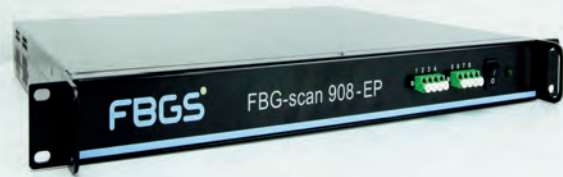
FBG Scan X0X EP