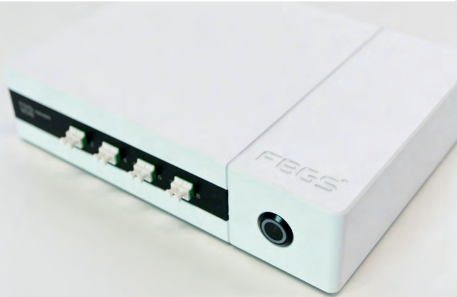
FBG Scan 90X

我们提供三款光纤光栅解调仪，分别是高精度FBG Scan 90X，高动态FBG Scan 80X和一体式FBG Scan X0X EP